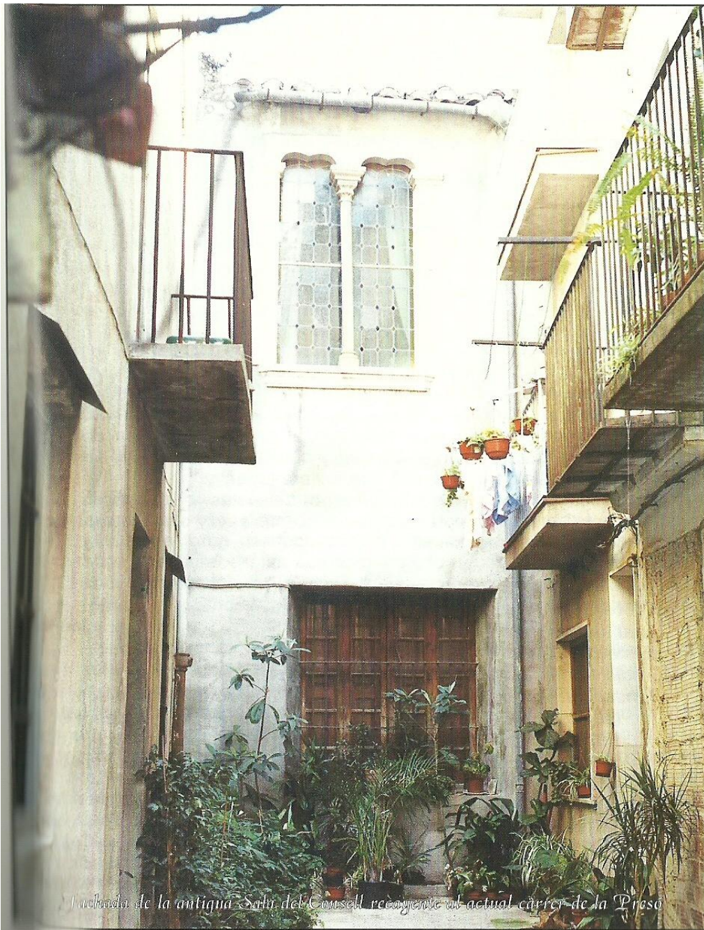
Entrada de la antigua Sala del Consell reconverte al actual carrer de la Preso