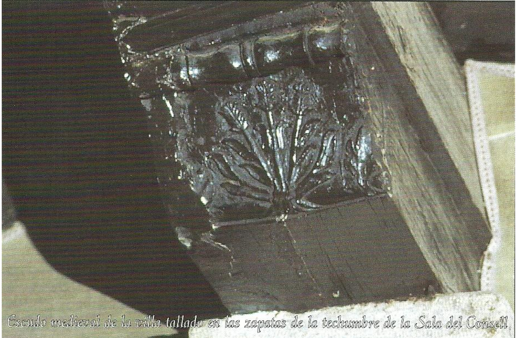
Escudo medieval de la villa tallado en las zapatas de la techumbre de la Sala del Consell.