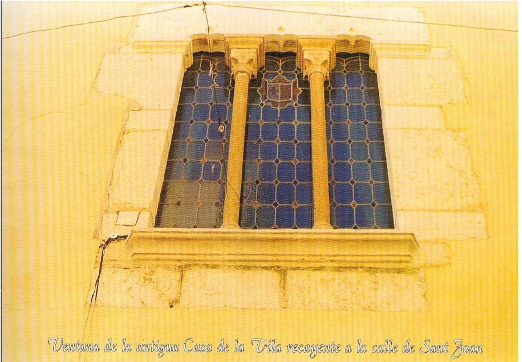
Ventana de la antigua Casa de la Vila recayente a la calle de Sant Joan